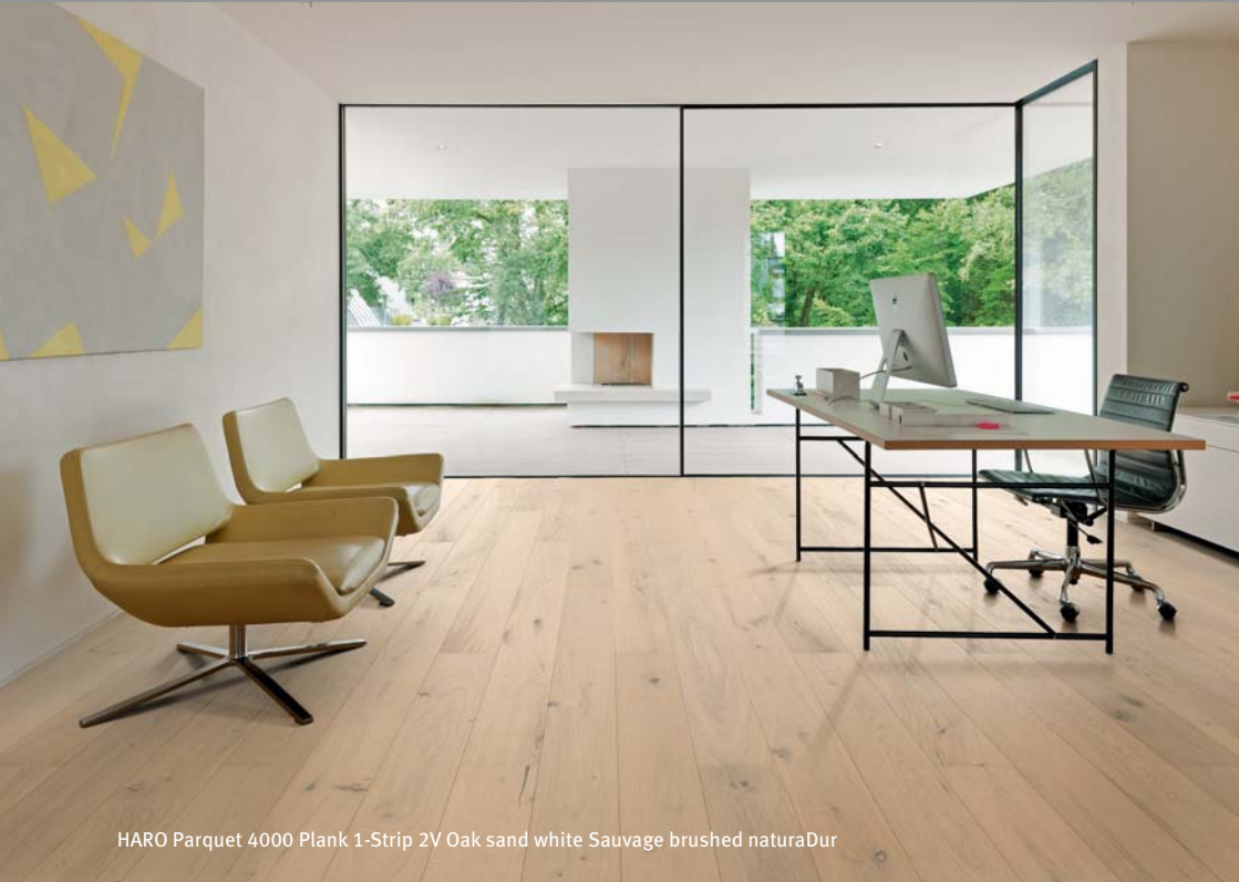
HARO Parquet 4000 Plank 1-Strip 2V Oak sand white Sauvage brushed naturaDur

Hamberger Flooring GmbH & Co. KG Posta kutusu 10 03 53 83003 Rosenheim Almanya