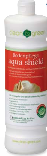
aqua shield zemin bakımı cilalı parke zemin ve kaplanmış yüzeyler

clean & green aqua shield ile zeminiz yeni gibi parlar. Ayrıca yüzeylerin yıpranmaya karşı dayanıklılıkları artar ve yukarıdan neme karşı korunur.