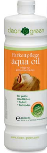
aqua oil parke bakımı

Yıpranmış, yağlı ve çok koyu renkli parkelerin yenilenmesi/onarımı için aqua oil black öneriyoruz. Beyaz yağlı parkeler için aqua oil white tavsiye ediyoruz.