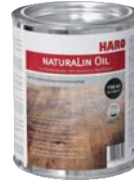
Spa Oil Natura