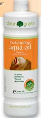
parke bakımı aqua oil